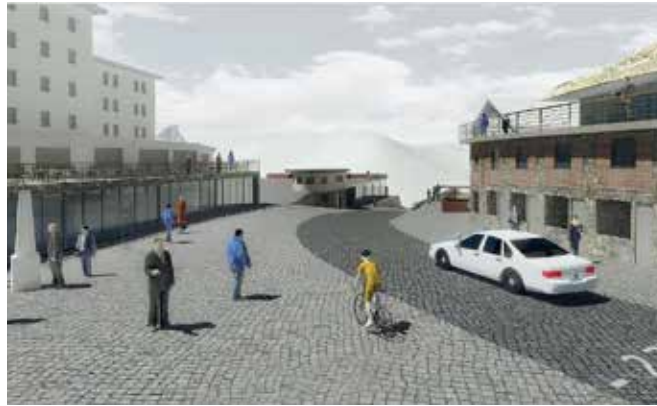
So könnte das Stilfser Joch nach der geplanten Aufwertung aussehen.

Südtirols Landeshauptmann Arno Kompatscher und der Präsident der lombardischen Land- und Forstwirtschaftsdienste (Ente regionale per i servizi dell'agricoltura e le foreste - ERSAF), Alessandro Fede Pallone, haben die Gründungsurkunde am 11. April in Bozen unterzeichnet. „Der mit 2.758 Metern ü.d.M. höchstgelegenen Pass Italiens ist das Ziel für unzählige Menschen, die mit dem Auto, Motorrad oder Fahrrad hierherkommen“, sagte Kompatscher. „Sie genießen inmitten des Nationalparks Stilfser Joch