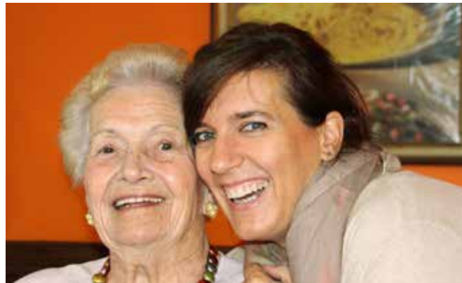
Die Großeltern sind für 64 Prozent der Befragten die wichtigsten Helferinnen und Helfer in der Vereinbarkeit von Familie und Beruf.

Nach der ersten Familienstudie im Jahr 2016 hat das Landesinstitut für Statistik (Astat) zwischen Oktober und Dezember 2021 wiederum Südtirols Familien befragt und die Studie in Zusammenarbeit mit der Familienagentur des Landes erstellt. Insgesamt 1.885 stichprobenartig ausgewählte Südtirolerinnen und Südtiroler zwischen 18 und 64 Jahren haben teilgenommen. In der Studie wird auf 40 Seiten ein umfassendes Bild der Familien in Südtirol gezeichnet. Er-