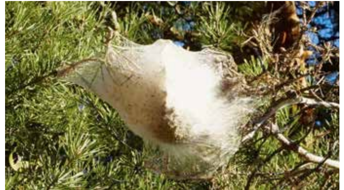
Weiße Raupen-Gespinstnester in den Kronen und an den Astenden der Kiefern weisen auf Befall durch den Prozessionsspinner hin.

Die Brennhaare dieser Forstschädlinge sind für den Menschen giftig und können unangenehme Reaktionen hervorrufen. Die Symptome reichen von Juckreiz über Hautreizungen bis hin zu möglichen Schleimhautentzündungen oder asth-