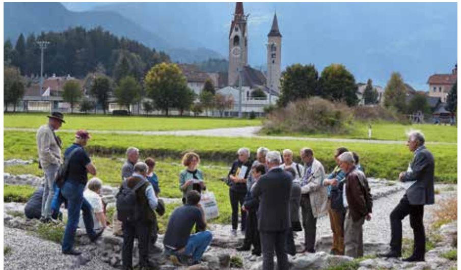
Besichtigung einer Ausgrabungsstätte der einstigen „Römischen Siedlung Sebatum/St. Lorenzen“

Nach und nach gelang es in den insgesamt zehn Bezirken Interessierte für die Mitarbeit zu gewinnen und für diese wichtige Dokumentationsarbeit zu begeistern. Die Betreuung der Ortschronisten obliegt den jeweiligen Bezirksverantwortlichen. Diese bilden gemeinsam den Landesbeirat, dem der Landeschronist vorsteht, der alle drei Jahre aus ihren Reihen gewählt wird. Dem Landesbeirat gehören die Archivdirektorin und die Referentin für das Chronikwesen an. Die Homepage des Südtiroler Landesarchivs enthält wichtige Hinweise zum Chronikwesen www.provinz.bz.it/kunstkultur/landesarchiv/chronikwesen.asp Zu einem wichtigen Fixpunkt im Jahreslauf der Chronisten ist der Tag der Chronistinnen und Chronisten in Bozen gewor-