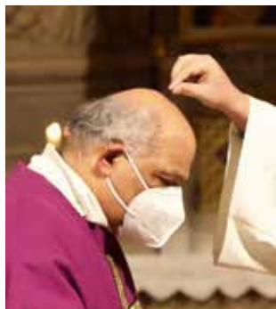
Die geweihte Asche erinnert an die Vergänglichkeit des Lebens.