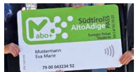
Ein Abo für alle Öffis im Land.

und weit über die Landesgrenzen bekannte Abo wurde im Februar vor zehn Jahren eingeführt. Passend zum Abo gibt es die App südtirolmobil mit vielen Infos. <