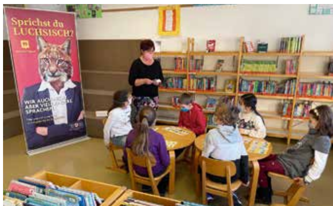
Im Bingo-Spiel kommen die sieben in Südtirol am häufigsten gesprochenen Sprachen vor.

Die Koordinierungsstelle für Integration nimmt den Gedenktag zum Anlass, um mit einem Bingo-Spiel anhand von Alltagssituationen, Bräuchen, Speisen, Tieren und Pflanzen in Südtirol spielerisch auf die sieben Sprachen aufmerksam zu machen, die in Südtirol am häufigsten gesprochen werden: Deutsch, Italienisch, Ladinitisch, Englisch, Arabisch,