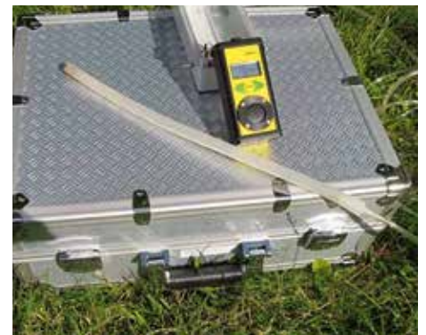
Die Berufsqualifikation als Experte oder Expertin für Baubiologie wurde neu eingeführt.

nommen und ist somit rechtsgültig. Der seit über zehn Jahren an der Landesberufsschule Schlanders erfolgreich durchgeführte und im ganzen Land bekannte Baubiologie-Lehrgang Ausgangspunkt ist für die neue berufliche Qualifikation. Aufbauend auf diese Erfahrung sind der Lehrgang neu durchdacht und die Fachkompetenzen definiert