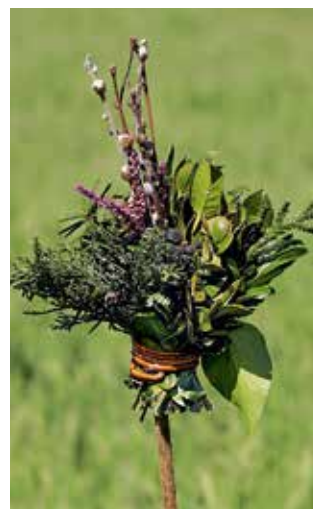
Der Palmbuschen soll eine gute Ernte sichern.

■ Rund um den Frühlingsbeginn, die Fastenzeit und das Osterfest gibt es eine Menge von Bräuchen. Viele von ihnen haben ihren Ursprung in der Zeit, als die Natur den Rhythmus der Menschen bestimmte. Im Frühjahr begann die Natur zu erwachen, die Tage wurden länger und der Winter wurde verabschiedet. Viele der Sitten und Brauchtümer wurden im Laufe der Jahrhunderte in einen christlichen Zusammenhang gebracht.