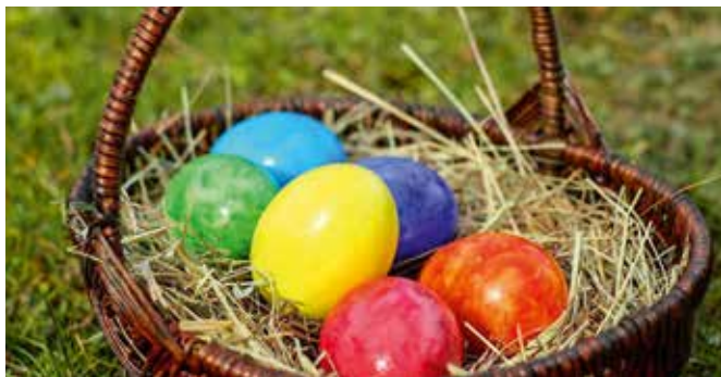
Die bunten Ostereier sind ein Symbol für die Fruchtbarkeit.

Vom Frühlingsbeginn, von der Natur und der Fruchtbarkeit