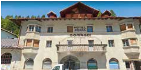
Das 1922 erbaute Hotel Post in Gomagoi

Das Hotel Post in Gomagoi war 1922 nach Plänen des Meraner Architekten Hans Hoffmann (1879 - 1936) erbaut worden. Das Hotel im sogenannten Heimatstil besteht aus drei Baukörpern entlang der Stilferjochstraße. Bei der Filialkirche der Gemeinde Stilfs handelt es sich ebenfalls um ein prägnantes Beispiel der Architektur der