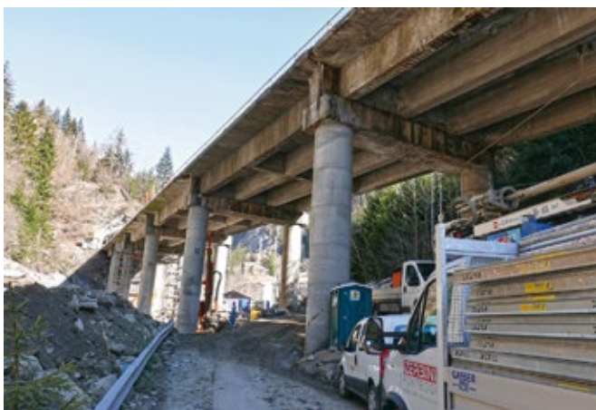
Die Schäden an der Brücke sind mit bloßem Auge sichtbar: Das Tragwerk muss komplett ausgetauscht werden.