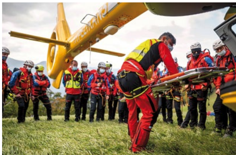
Übung des Bergrettungsdienstes

Die Vereinheitlichung der ausgeübten Disziplinen und der verschiedenen Unfallursachen war grundlegende Herausforderung bei der Erstellung der gemeinsamen Datenbank und Datenbasis, die in Zukunft auch mit den nördlichen Nachbarländern vergleichbar sein soll und auch vom österreichischen Kuratorium für Alpine Sicherheit statistisch ausgewertet werden wird. Nun enthält die Datenbank 44 verschiedene Disziplinen bzw. ausgeübte Tätigkeiten, 20 verschiedene Unfallursachen und die Unfallfolgen sind in fünf Klassen kategorisiert. Die Sammlung der Daten, betonen der Vorsitzende des Bergrettungsdienstes im AVS Ernst Winkler und der Vorsitzende der Südtiroler Berg- und Höhlenrettung CNSAS Giorgio Gajer, bedeute zwar einen Mehraufwand an Arbeit für die Freiwilligen, stelle aber eine wertvolle Vereinheitlichung dar und ermögliche zugleich, etwa aus einer Häufung von Unfällen in einem bestimmten Gebiet abzulei-