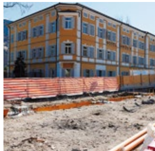
Die Bauarbeiten für das Mobilitätszentrum in Brixen sind in vollem Gang.

Beim Bahnhof in Brixen wird ein Mobilitätszentrum errichtet und der Bahnhofsplatz neu gestaltet. Nach den umfangreichen Umbauarbeiten soll es künftig möglich sein, bequem