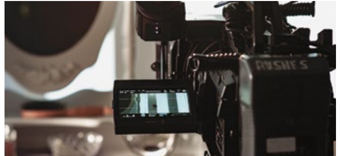
Das Land hat die Filmförderung auch 2020 fortgesetzt.

Als zweitbeste europäische Film-Location wurde der Reschensee ausgezeichnet, der Hauptdrehort der Netflix-Serie „Curon“, die in über 190 Ländern der Welt ausgestrahlt wurde. Mit ihrem Debütfilm „Hochwald“ gewann die Bozner Regisseurin Evi Romen mit dem Pusterer Schauspieler Thomas Prenn in der Hauptrolle auf dem Film Festival Zürich das „Goldene Auge“ für den besten Film. Der Streifen lief zudem auf der Viennale, dem Torino Film Festival und dem hochkarätigen