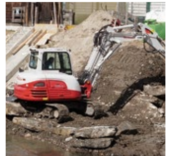
Bau einer Pegelmessstelle

Seit 1975 betreibt die Landesagentur für Bevölkerungsschutz ein landesweites Pegelmessnetz mit insgesamt rund 50 Messstellen zur Überwachung der Fließgewässer in Südtirol. Im Zeitraum 2007 bis 2013 waren acht Projekte über den Europäischen Fonds für regionale Entwicklung fi-