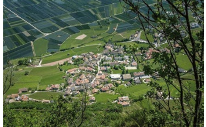
Bis 1. Juli 2021 haben die Gemeinden (im Bild Kurtatsch) Zeit, um ihre Gemeindebauordnungen an die Musterbauordnung anzupassen und die neuen Gemeindekommissionen zu ernennen.

Die Gemeinden bekommen auch mehr Zuständigkeiten in der Planung des eigenen Raums. Eine